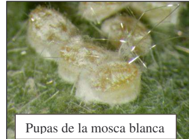
Pupas de la mosca blanca

Los jóvenes mudarán y pasarán a través de varias etapas de crecimiento siendo inicialmente de forma oval, plana y finalmente más convexa. Estas formas no se asemejan al insecto típico.