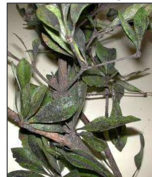
Fumagina en Black-olive

Manejo en los jardines: Frecuentemente cuando una nueva plaga se establece por primera vez en un área, puede desarrollar niveles altos de población y puede ser extremadamente dañina. No obstante, es común que después de algunos años el impacto de la plaga se vea reducido. Aunque puede ser necesario el uso de insecticidas, es muy importante de entender la importancia de los enemigos naturales y la necesidad de enfocarnos en el control a largo plazo, en armonía con el medio ambiente. Algunos concejos importantes son: