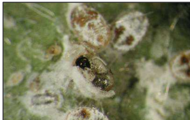
Pupas de la mosca blanca parasitadas