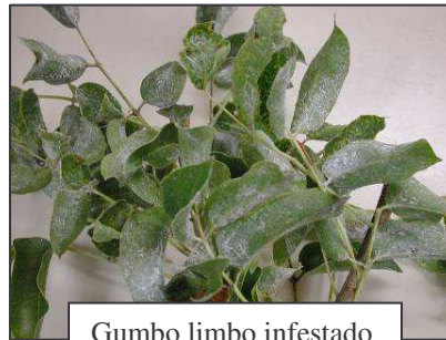
Gumbo limbo infestado