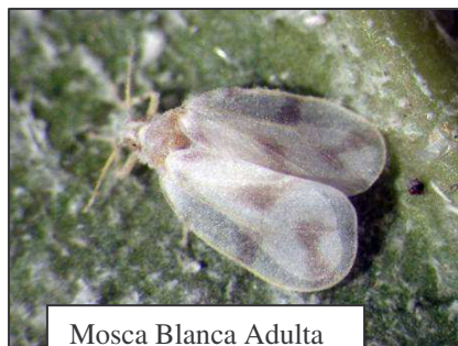
Mosca Blanca Adulta

Introducción: En marzo del 2009, una mosca blanca ( Aleurodicus rugioperculatus Martin: Hemípteros: Aleyrodidae), fue detectada en el condado de Miami-Dade en árboles de Gumbo Limbo. Este fue el primer reporte de este insecto en todo el continente de Estados Unidos, se cree que viene de America Central. Desde su reporte inicial, han habido numerosos reportes en todo el condado. Probablemente se extienda a otros condados del Sur de la Florida.