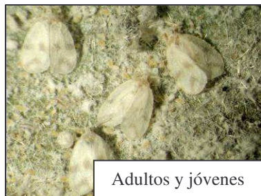
Adultos y jóvenes

Biología: Existe poca información sobre la biología de este insecto, no obstante actualmente se está efectuando investigación para describir el ciclo de vida y las