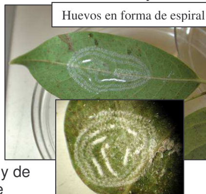
Huevos en forma de espiral

mosca blanca típica de Estados Unidos y es mas dócil y de movimientos lentos. Los adultos se juntan en el lado de